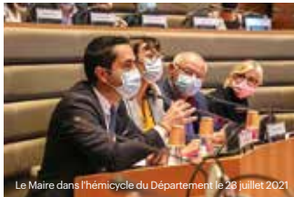
Le Maire dans l'hémicycle du Département le 28 juillet 2021

L'équipe municipale a fait du renforcement de ses partenariats institutionnels une priorité financière. Face à la baisse considérable des aides de l'État et aux incertitudes économiques actuelles, la Ville d'Allauch a pris l'engagement, dès 2020, de soumettre ses grands projets à l'aide des partenaires institutionnels que sont la Région, le Département des Bouches-du-Rhône, la Métropole ou encore la CAF ou la DRAC. Un groupement de partenariats qui s'élargit même à l'Europe, comme dans le cadre d'un projet pour améliorer la qualité de l'air aux abords des écoles, qui a été lancé en février 2022, à Allauch.