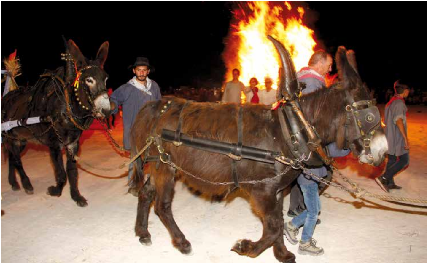
Le traditionnel feu de la Saint-Jean au Théâtre de Nature.