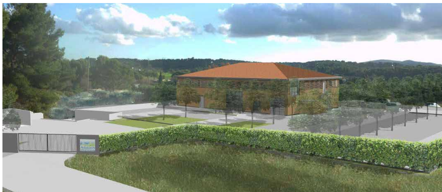
Le futur Centre Technique Municipal aux Aubagnens à la Pounche.

A l'extérieur, les aménagements comprendront une voie générale qui permettra l'accès au droit des façades pour les zones d'approvisionnement, de livraison des repas, de retour du matériel de transport, de sortie des déchets.