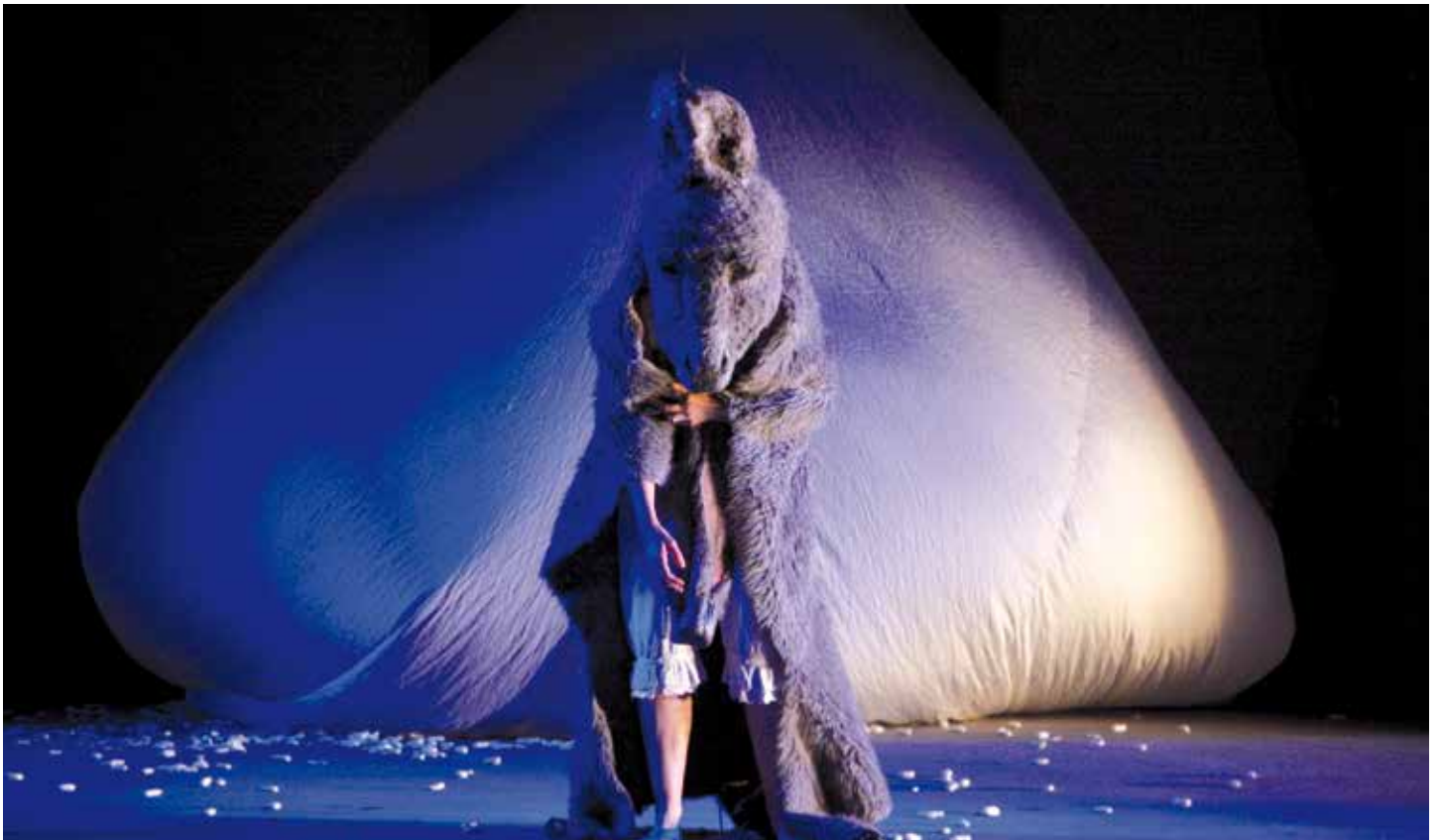
A mi-chemin entre théâtre et comédie musicale «Peau d'âne» est considéré comme l'un des premiers contes de fées français. Une adaptation fidèle du conte de Perrault nous était présentée pour les Estivales d'Allauch rythmée par les chansons du film culte de Jacques DEMY.