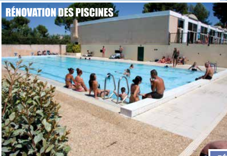
RÉNOVATION DES PISCINES