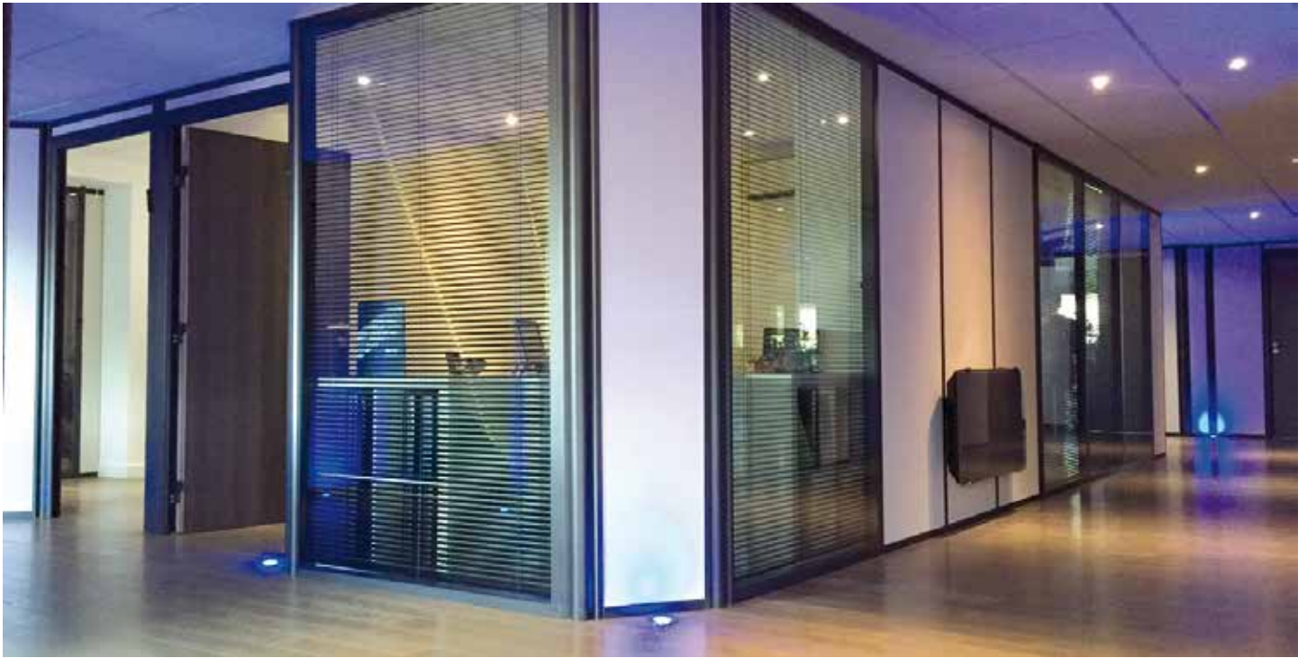
Les locaux accueillants de Sportimmo.

SPORTIMMO a su développer son activité avec dynamisme et passion.