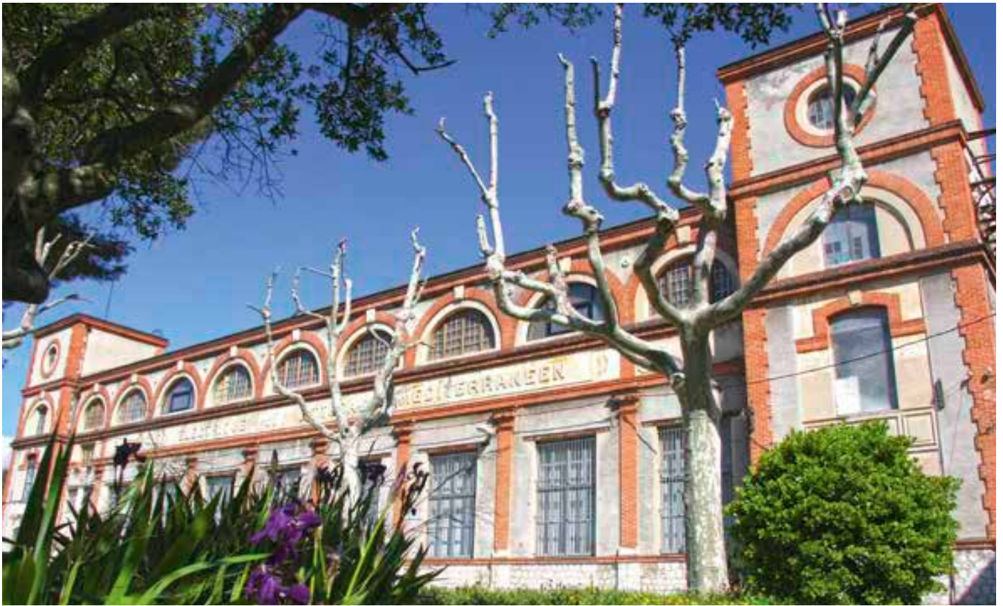
Lusine électrique, à l'entrée du village, va devenir un véritable pôle culturel.