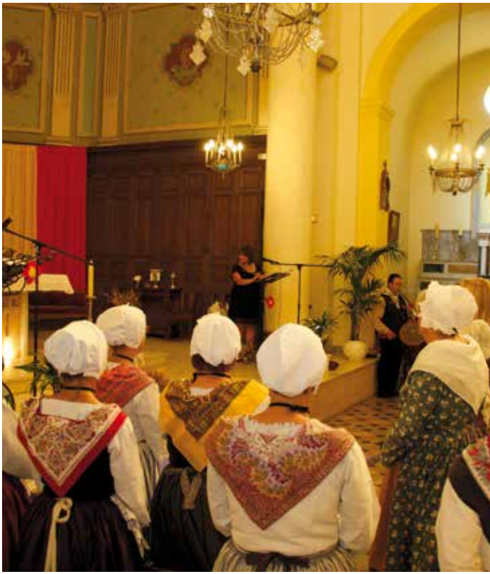
Messe en l'église de la Bourdonnière.