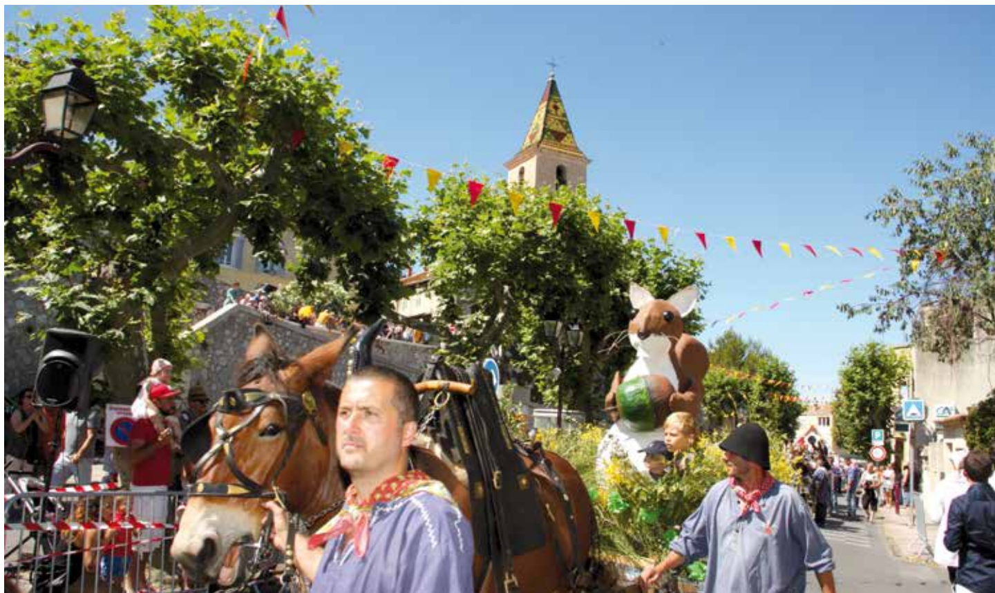
La grande cavalcade, point d'orgue des fêtes de la Saint-Jean.