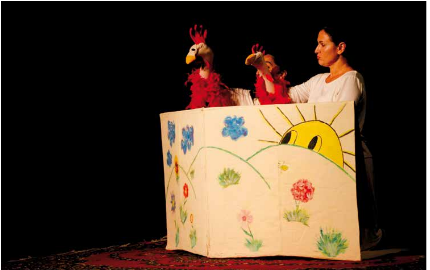
Concert Bout'chou les enfants ont pu profiter d'un concert conçu pour eux par la Compagnie Elliptique