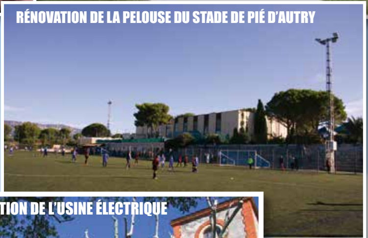
RÉNOVATION DE LA PELOUSE DU STADE DE PIÉ D'AUTRY