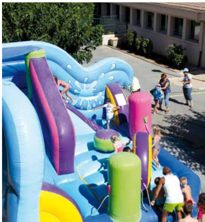
Des animations ludiques et sportives ont été organisées dans la cour de l'école.