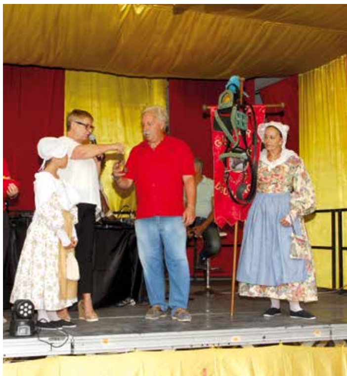
Ouverture des fêtes de la Saint-Laurent.