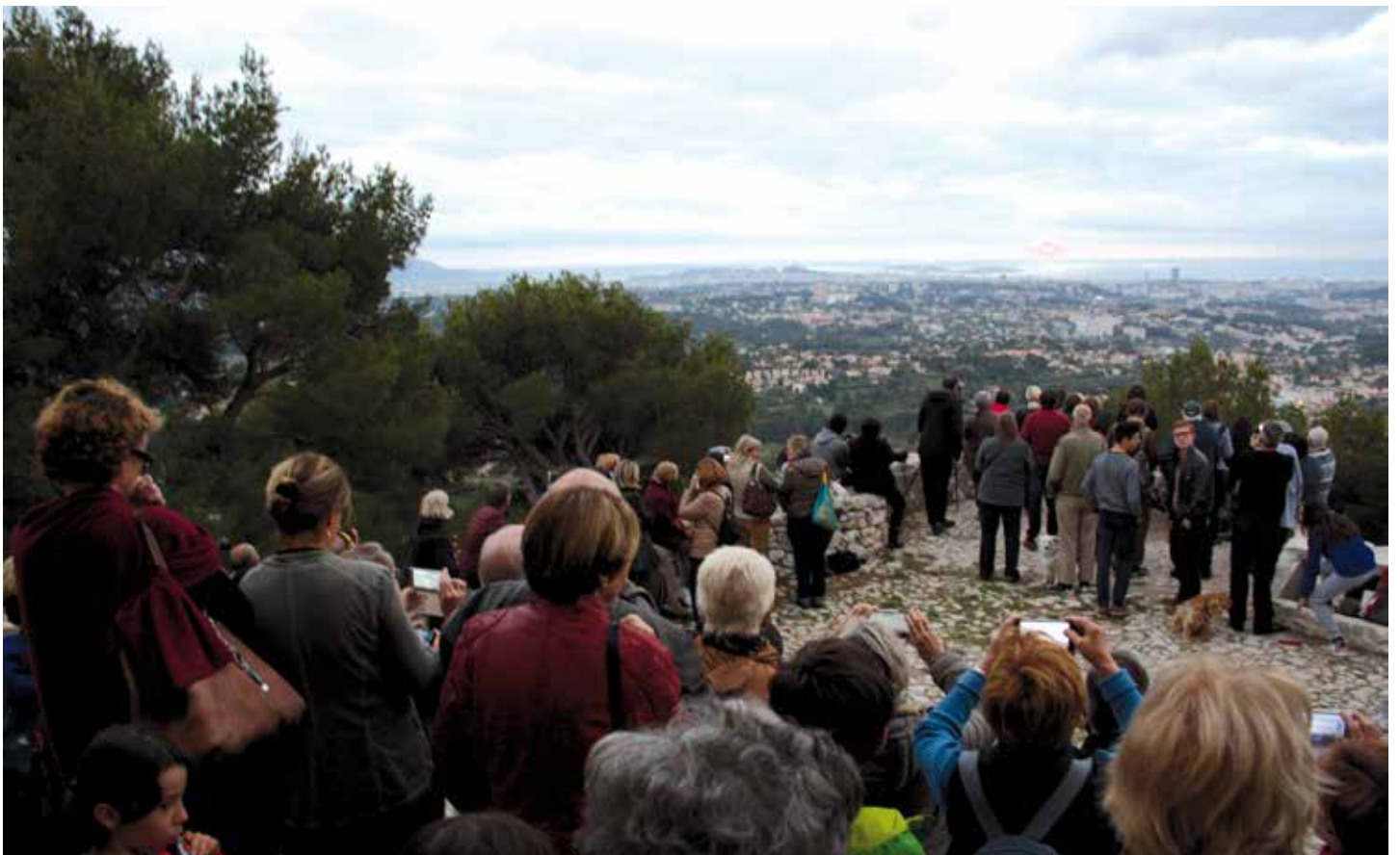
Observation du massif du Canigou (2785m), dans les Pyrénées orientales depuis le parvis de Notre-Dame du Château mardi 1er novembre. Ce véritable mirage atmosphérique est visible lors du coucher du soleil. Un rendez-vous scientifique animé par Alain ORIGNÉ, ingénieur de recherches au CNRS, organisé par l'association Pour Notre-Dame du Château.