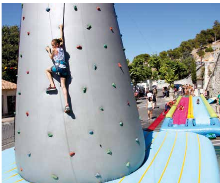
La journée des enfants, très attendue chaque année, avec mur d'escalade et structures gonflables.