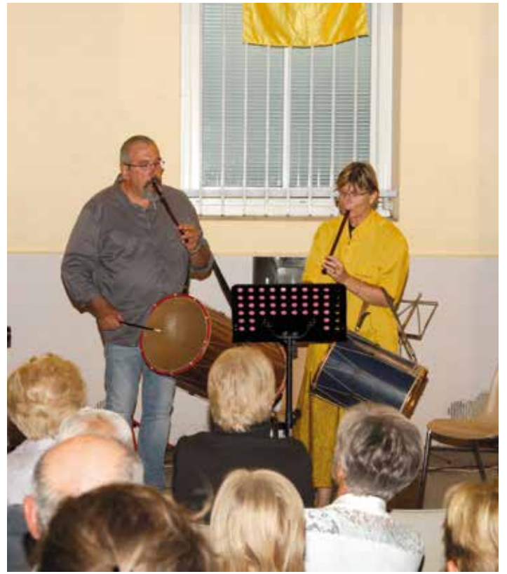
La traditionnelle veillée provençale.