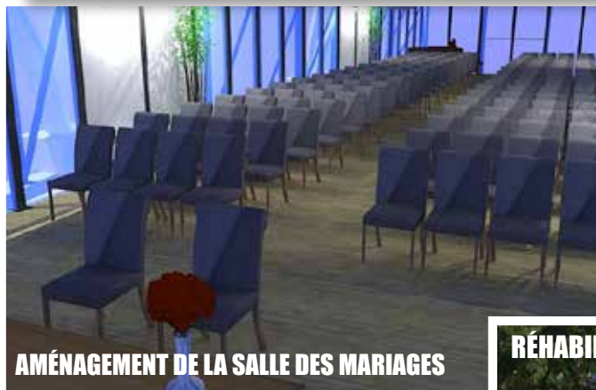
AMÉNAGEMENT DE LA SALLE DES MARIAGES