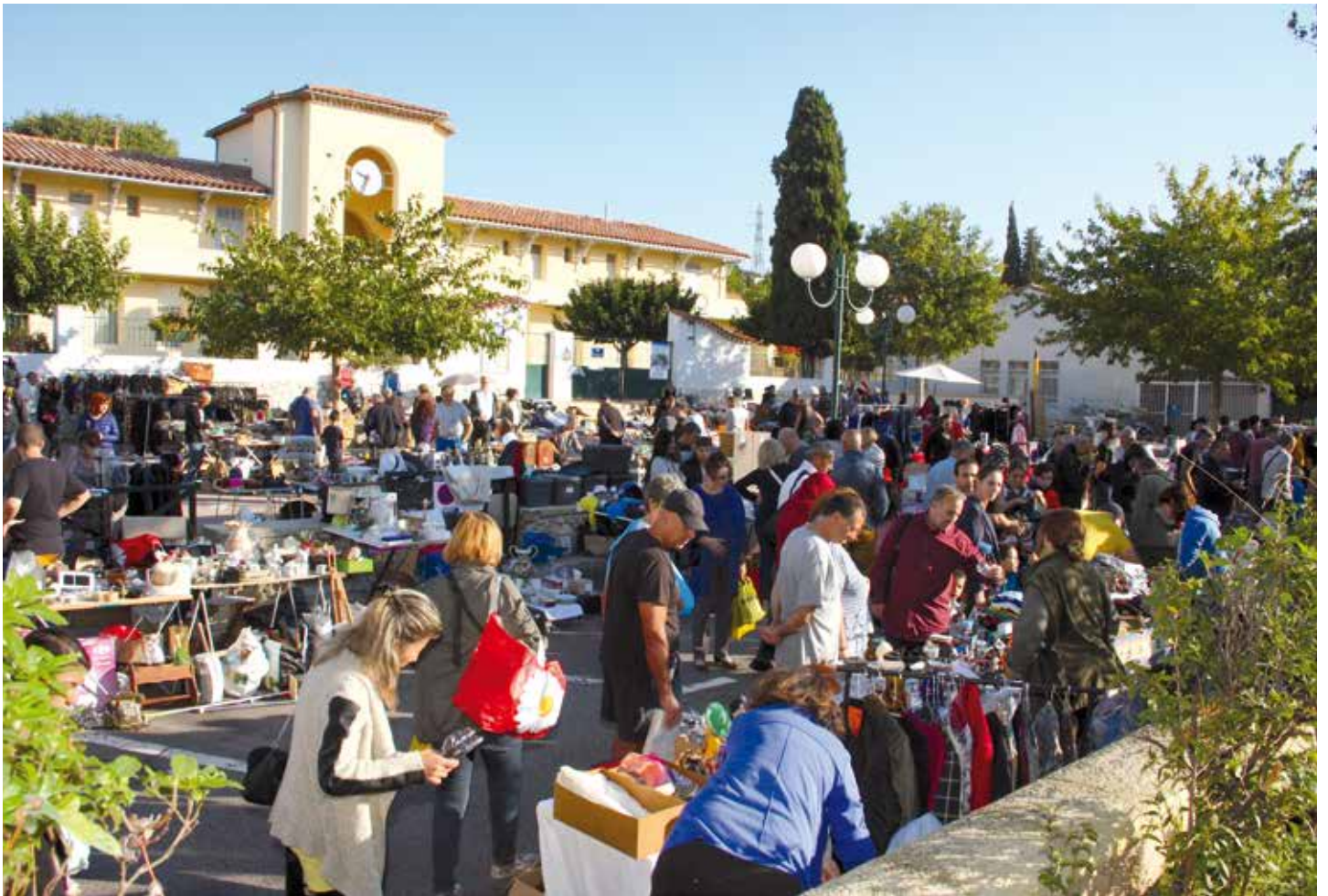
Dimanche 2 octobre 2016 se tenait la Brocante et vide-grenier du Groupe St-Eloi du Logis-Neuf. Le rendez-vous automnal des chineurs allaudiens désireux de dénicher des objets insolites ou classiques.