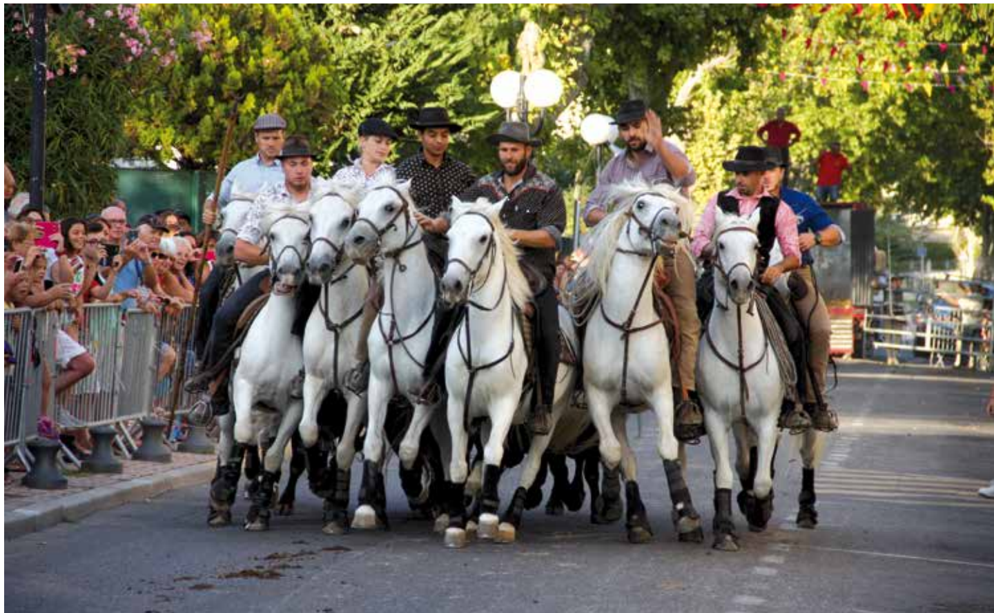
Abrivado sur l'avenue Leï Rima par la manade Vallat.