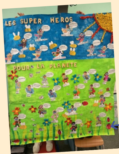
Classe de Grande Section de l'école maternelle Pie d'Autry.

Les œuvres gagnantes sont à découvrir en images ci-dessous un bel aperçu de la créativité et de l'engagement des jeunes allaudiens pour la planète !