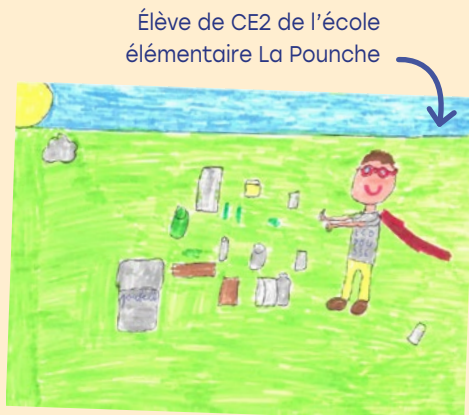
Élève de CE2 de l'école élémentaire La Pounche